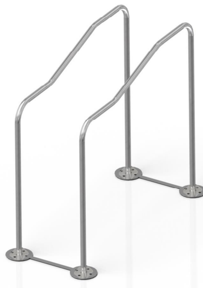
Vizualizace mají pouze ilustrační charakter Právo na změny vyhrazeno

Poznámka: Maximální hmotnost uživatele je 120 kg. Druhé osobě je zakázán vstup do vzdálenosti 2m do uživatele. Zařízení smí bez dozoru užívat pouze osoby starší 14 let.