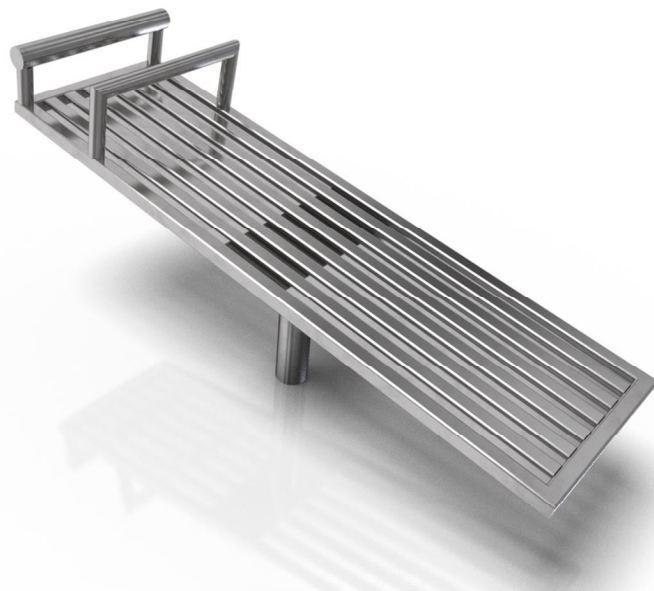
Vizualizace mají pouze ilustrační charakter Právo na změny vyhrazeno