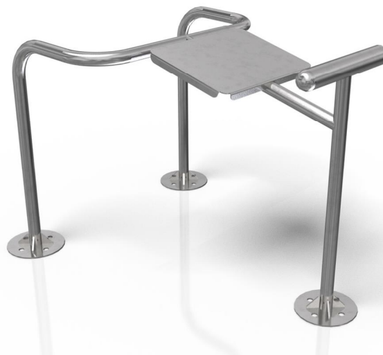
Vizualizace mají pouze ilustrační charakter Právo na změny vyhrazeno

Poznámka: Maximální hmotnost uživatele je 120 kg. Druhé osobě je do vzdálenosti 2 m od uživatele vstup zakázán. Zařízení smí bez dozoru užívat pouze osoby starší 14 ti let. Jiné než uvedené použití je zakázáno.