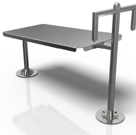
Vizualizace mají pouze ilustrační charakter Právo na změny vyhrazeno

Poznámka: Maximální hmotnost uživatele je 120 kg. Druhé osobě je do vzdálenosti 2 m od uživatele vstup zakázán. Zařízení smí bez dozoru užívat pouze osoby starší 14 ti let. Jiné než uvedené použití je zakázané.