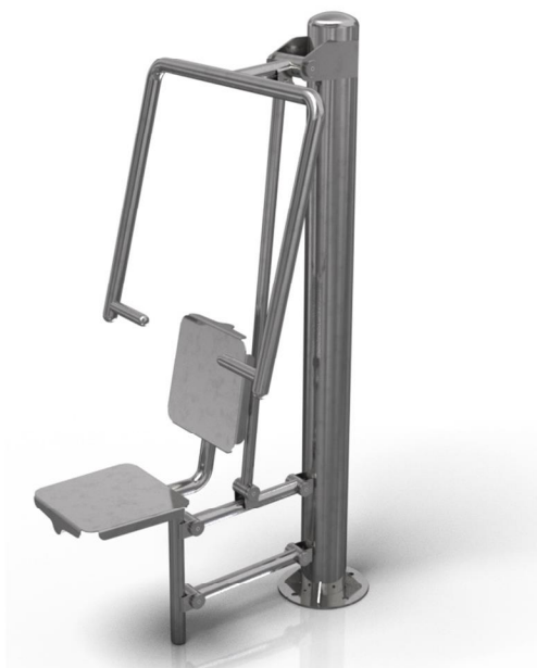
Vizualizace mají pouze ilustrační charakter Právo na změny vyhrazeno

Poznámka: Maximální hmotnost uživatele je 120 kg. Druhé osobě je zakázán vstup do vzdálenosti 2m od uživatele. Zařízení smí užívat pouze osoby starší 14 let. Jiné než uvedené použití je zakázané.