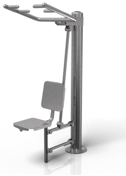
Vizualizace mají pouze ilustrační charakter Právo na změny vyhrazeno

Poznámka: Maximální hmotnost uživatele je 120 kg. Druhé osobě je zakázán vstup do vzdálenosti 2m od uživatele. Zařízení smí bez dozoru užívat pouze osoby starší 14 let. Jiné než uvedené použití je zakázané.