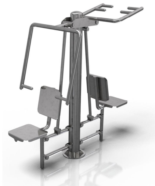
Vizualizace mají pouze ilustrační charakter Právo na změny vyhrazeno

Poznámka: Maximální hmotnost uživatele je 120 kg. Druhé osobě je zakázán vstup do vzdálenosti 2m od uživatele. Zařízení smí bez dozoru užívat pouze osoby starší 14 let. Jiné než uvedené použití je zakázáno.