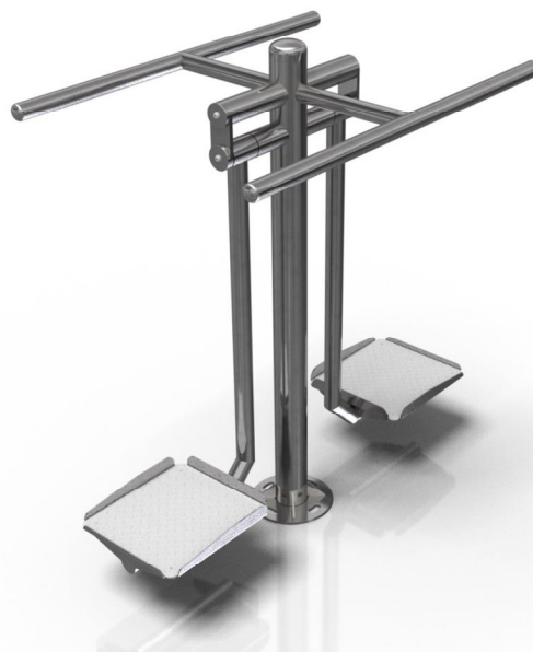
Vizualizace mají pouze ilustrační charakter Právo na změny vyhrazeno

Poznámka: Maximální hmotnost uživatele je 120 kg. Druhé osobě je zakázán vstup do vzdálenosti 2m od uživatele. Zařízení smí bez dozoru užívat pouze osoby starší 14 let. Jiné než uvedené použití je zakázané.