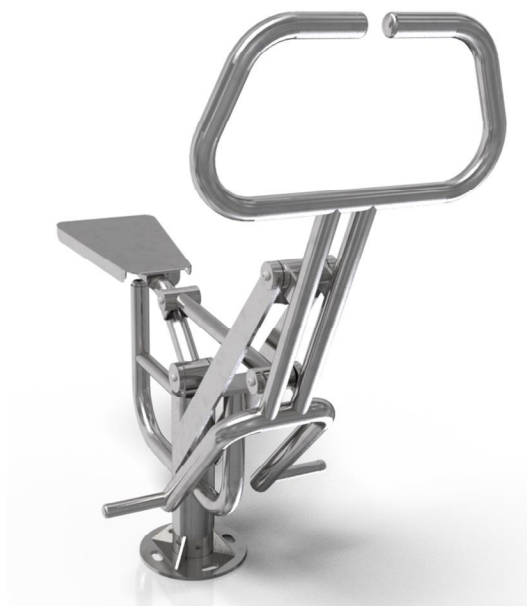
Vizualizace mají pouze ilustrační charakter Právo na změny vyhrazeno

Poznámka: Maximální hmotnost uživatele je 120 kg. Druhé osobě je zakázán vstup do vzdálenosti 2m od uživatele. Zařízení smí bez dozoru užívat pouze osoby starší 14 let. Jiné než uvedené použití je zakázáno.