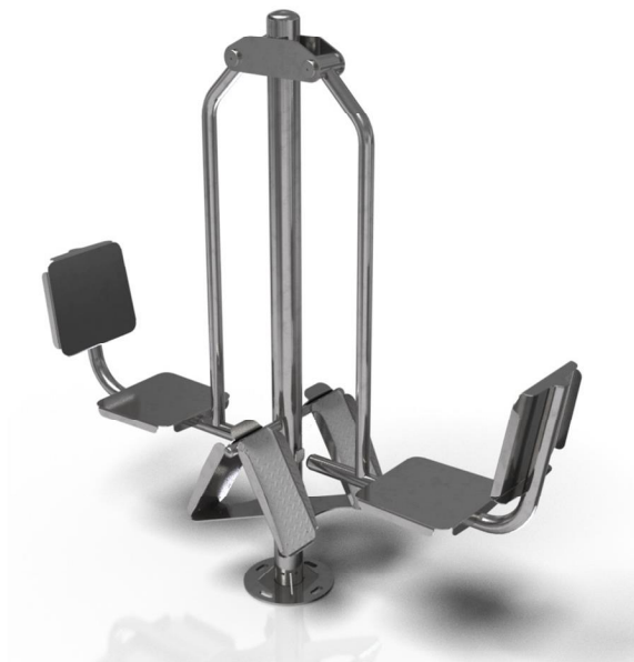
Vizualizace mají pouze ilustrační charakter Právo na změny vyhrazeno

Poznámka: Maximální hmotnost uživatele je 120 kg. Druhé osobě je do vzdálenosti 2 m od uživatele vstup zakázán. Zařízení smí užívat pouze osoby starší 14 let. Jiné než uvedené použití je zakázané.